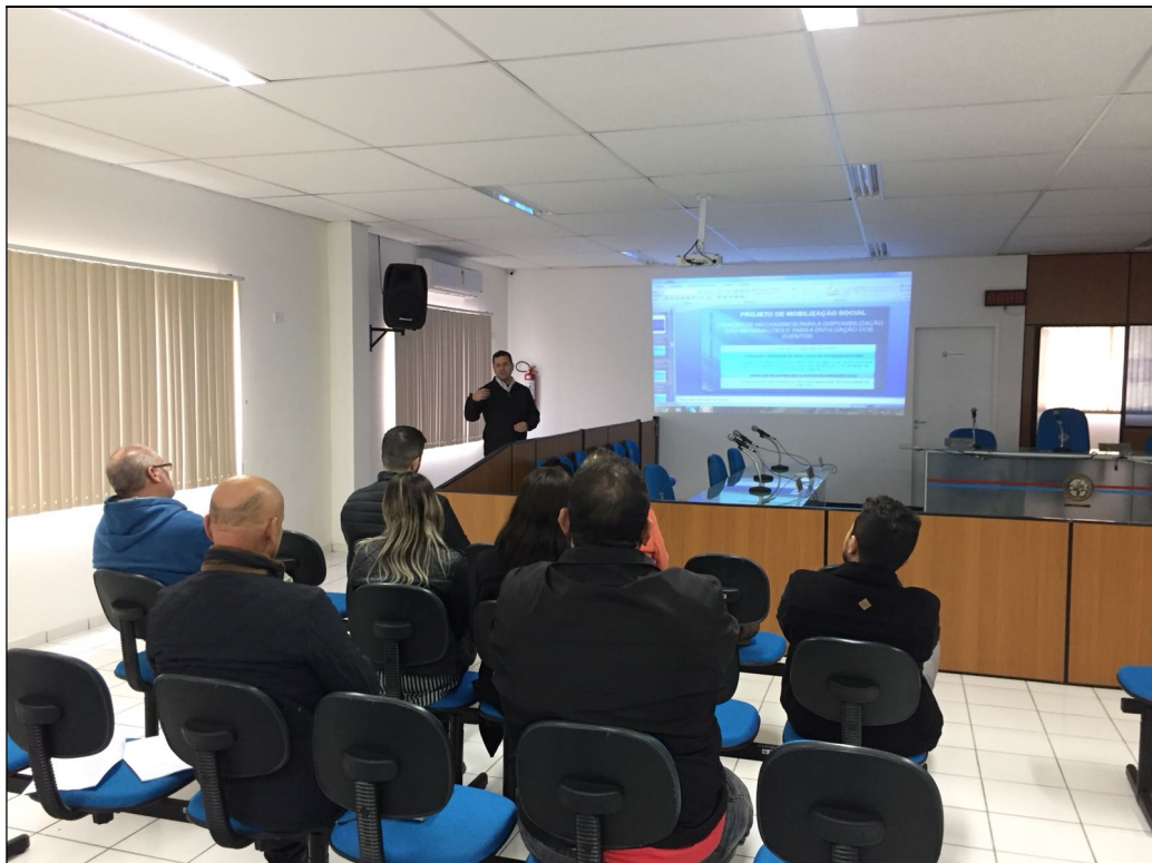
Figura 1 – Realização da Oficina (Meta 1)

A apresentação dos conteúdos técnicos foi realizada por meio de software (PowerPoint) e formatada de modo a facilitar a compreensão dos participantes (ver Anexo 2).