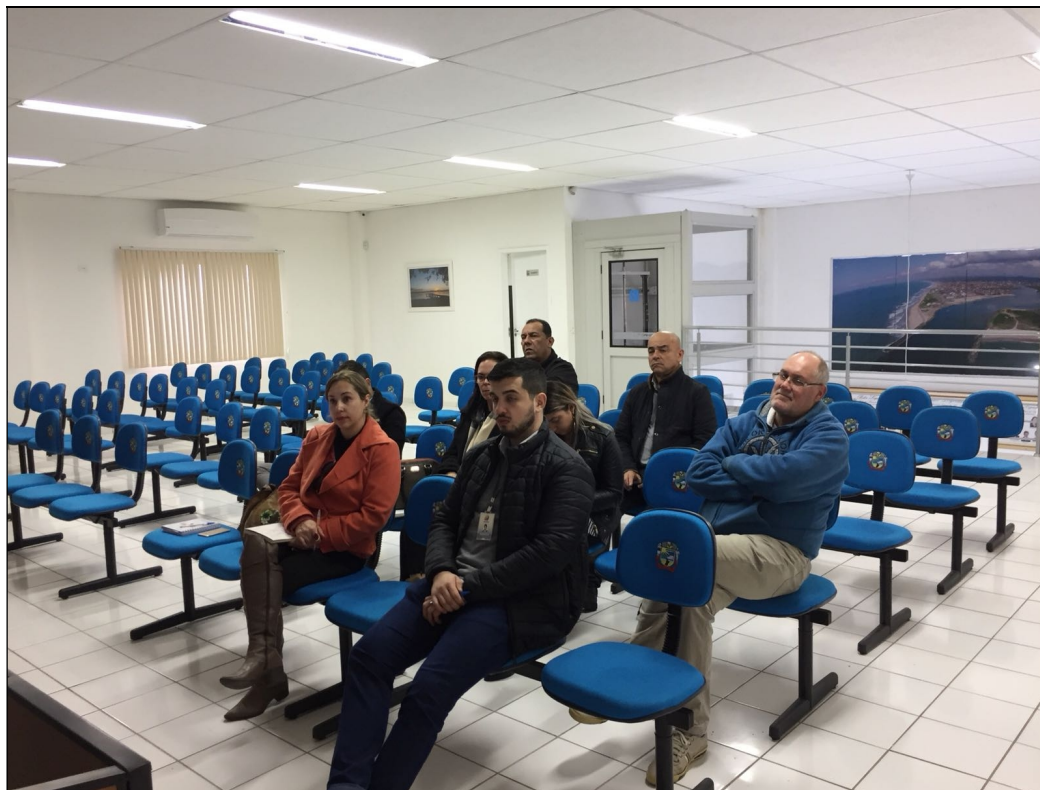
Figura 2 – Realização da Oficina (Meta 1)

A estruturação, organização, condução, logística, definição de local e funcionamento da oficina foi de comum acordo entre a Consultora e o Comitê Diretor Local. A lista de presença e a ata do evento podem ser visualizadas, respectivamente, no Anexo 3 e no Anexo 4.